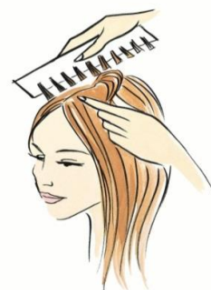
LIFT & BUMP